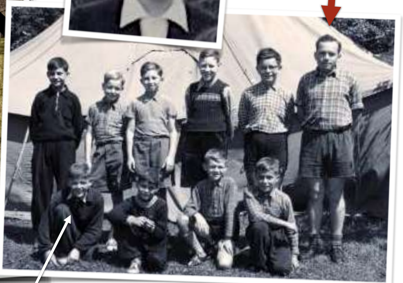
(F.Prinz) Jungscharlager 1955